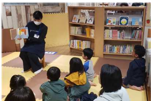
定例会おはなし会