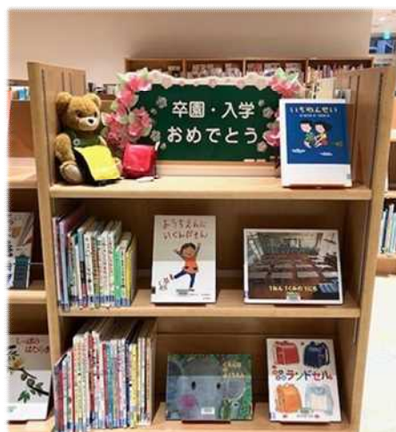
3月)入園・入学おめでとう