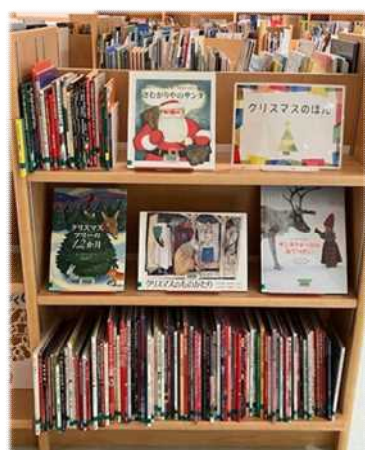
12月)クリスマスの本