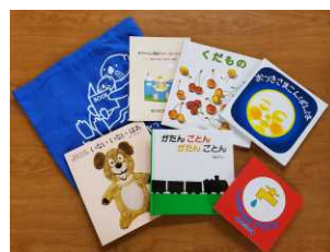
【ブックスタートパック】