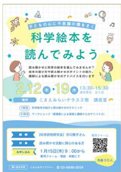
2月)「科学絵本を読んでもみよう」ポスター