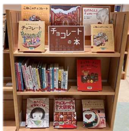
2月)チョコレートの本